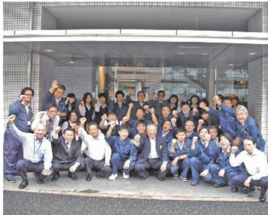
トップと社員の笑顔が近いアットホームな雰囲気