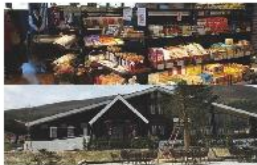
4月、広島県大田市に「石見ワイナリー」を創業