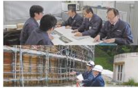
日々のパトロールで安全管理と品質管理に努める

50年以上の施工実績と信頼性を誇る、広島県内トップクラスの設備工事専門会社。「三歩先を考え、二歩先を動く、一歩先を歩く」をモットーに、「日々研さんする。技術向上と安全確保に努め、品質管理活動を実施。本社のほか、島根、山口に支店、東京、呉、東広島、岩国に営業所を設け、空調から給排水衛生、電気、消防、冷凍冷蔵、上下水道、プラント整備、太陽光発電システムまで多種多様な設計・施工を行う。大型建築物の整備を得意とし、修理修繕や機器更新も対応。24時間365日のメンテナンス体制の先駆者で、故障や誤作動が発生した時は休日夜間を問わず駆け付けれる。きめ細やかなサービスで安全・安心を提供して厚い信頼を得ている。 技術向上や社員の安全確保に力を入れるほか、2014年には経済産業大臣の「高圧ガス保安表彰」を受けた。環境保全への取り組みも盛んで、環境への配慮とコスト削減を両立する省エネルギー設備工事を提案する。太陽光発電や地中熱空調システムなどの工事を多数手掛ける。大型設備の省エネ実績も増えている。